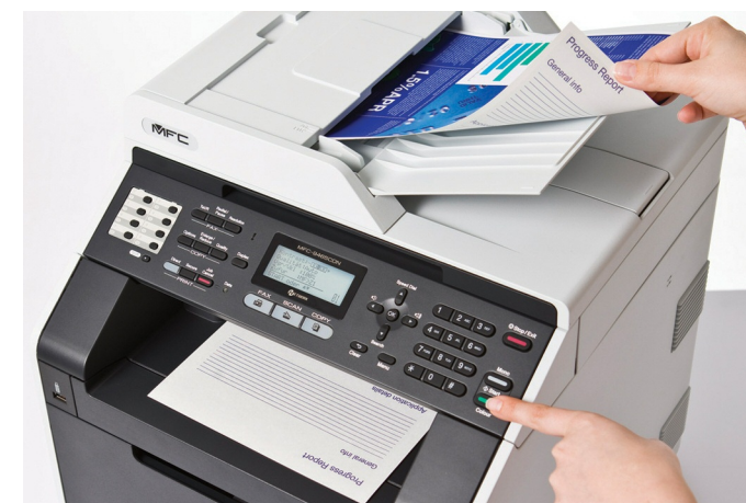
Scansiona e copia documenti in fronte/retro con estrema facilità