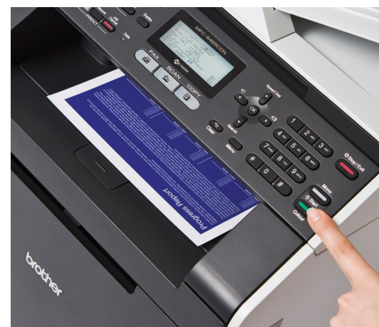
Stampa fronte/retro automatica per documenti aziendali professionali

Veloce, affidabile, facile da usare e completo di funzioni. La perfetta combinazione per ottimizzare tempi e costi.